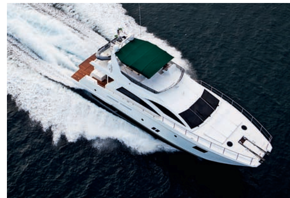
Lo yacht è proposto dal cantiere con layout diversi. Il modello presentato nelle foto che corredano l'articolo ha la cucina sulla sinistra e la zona conversazione a tutta larghezza.